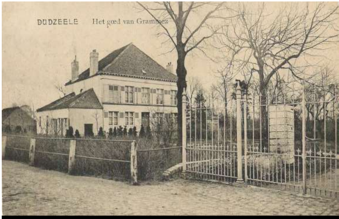
Het Goed van Gramez anno 1905

schrijfwijze : ca. 1525 koopt Hugo van Gramez, die één van de naaste medewerkers was van keizer Karel was, het goed; het wordt sedert ca. 1330 vermeld als leengoed; we zullen 'van Gramez' dus hierna vermelden met één 'm', ook al wordt het in andere documenten en prenten als 'van Grammez' of gewoon 'Grammez' geschreven; dit laatste is echter niet juist want de naam was wel degelijk 'Hugo van Gramez', met een kleine 'v' want hij was van adel